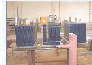
ANODES DE CHLORATE CHPC -TAIWAN