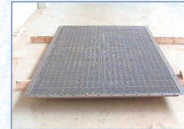
ANODES DE CHLORE POUR CELLULES DE MEMBRANE ARAGONESAS-SPAIN